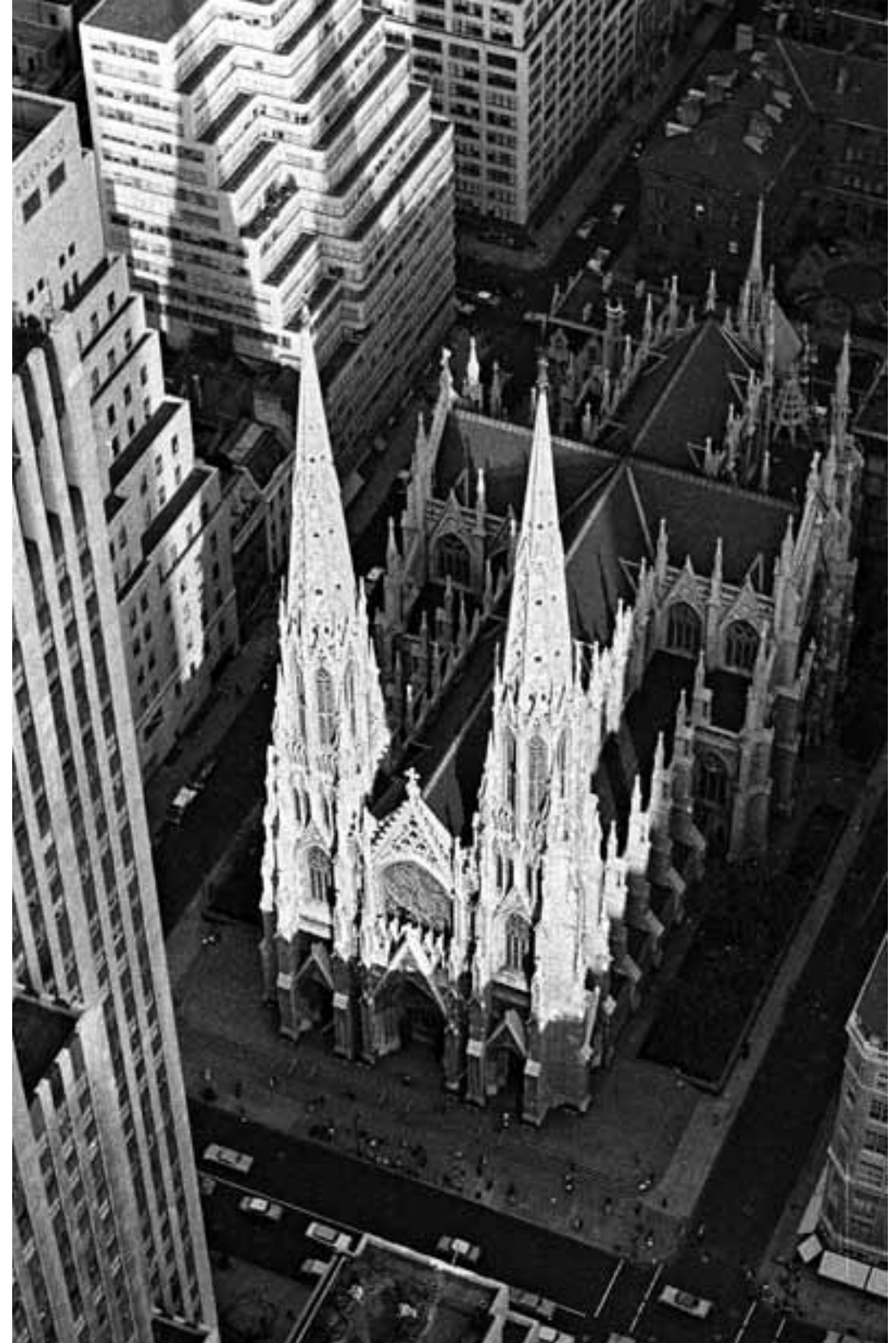
Saint Patrick's Cathedral as seen from the top of the RCA Building in Rockefeller Center Blick auf die Sankt Patrick Kathedrale von der Spitze des RCA Gebäudes im Rockefeller Center