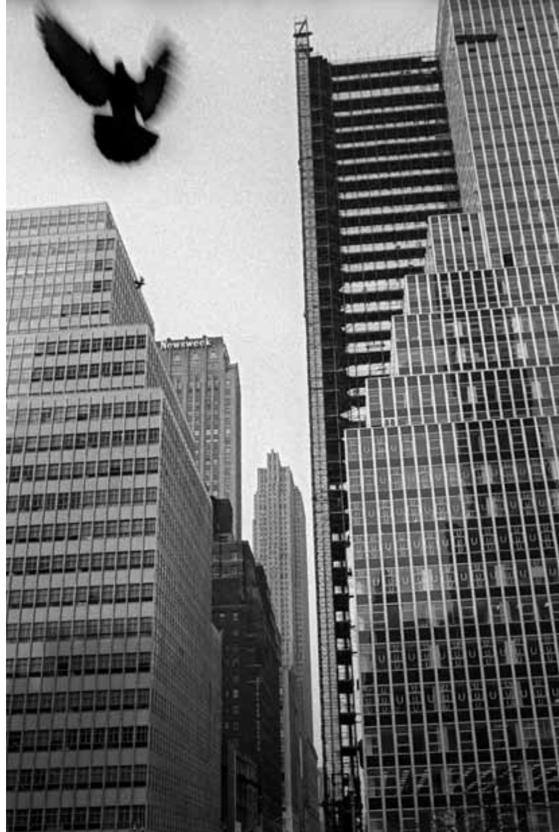
Madison Avenue, Manhattan