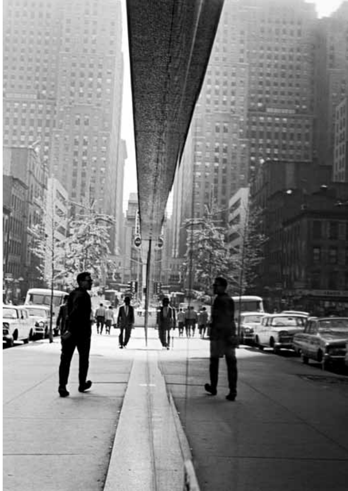
Window on East 42nd Street Spiegelung auf der 42. Straße