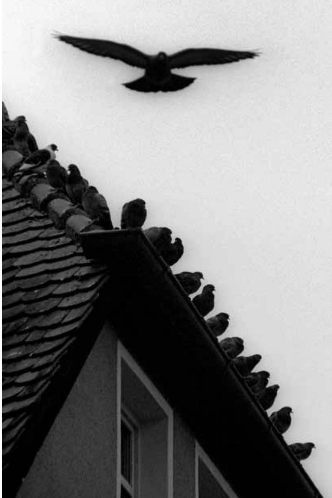
In der Altstadt Within the Old City