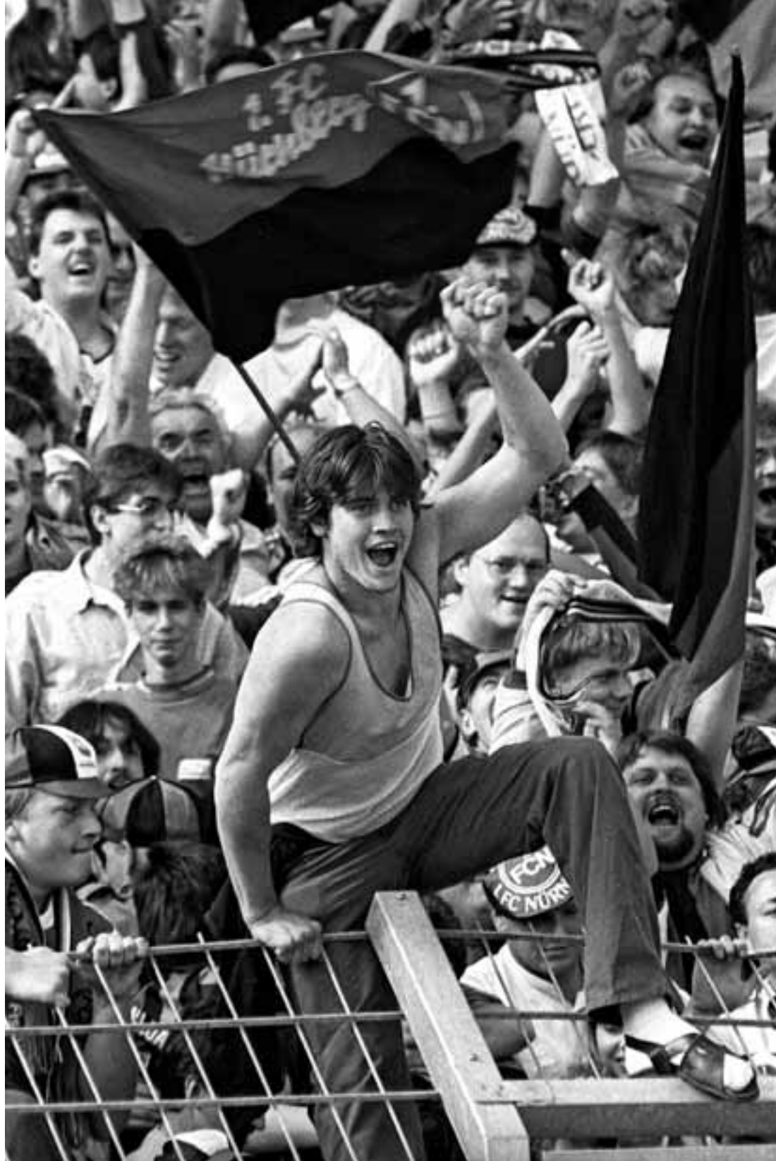
Clubberer im Frankenstadion Soccerfans at the local stadium