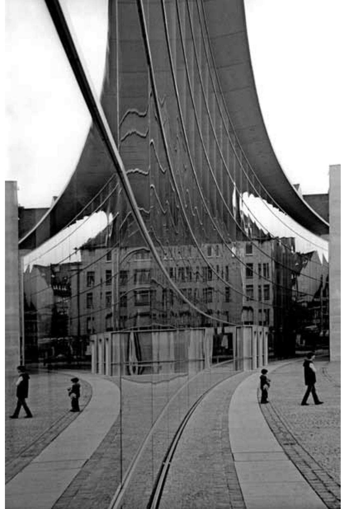
Fassade des Neuen Museums am Klarissenplatz Facade of the Neues Museum