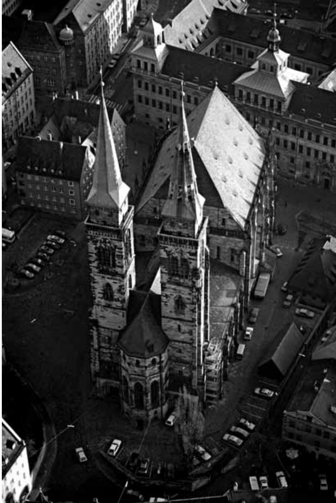
Sebalduskirche aus der Vogelperspektive Bird's eye view of Saint Sebald